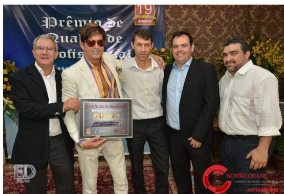
Equipe do Banco do Brasil

A grande atração do evento foi a presença VIP do famoso cirurgião plástico e apresentador Dr. Robert Rey, conhecido como “Dr. Hollywood”, o qual realizou as entregas dos certificados.