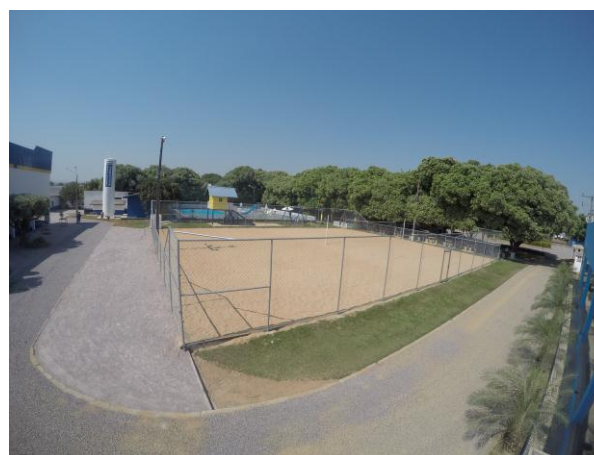
Quadra de Areia